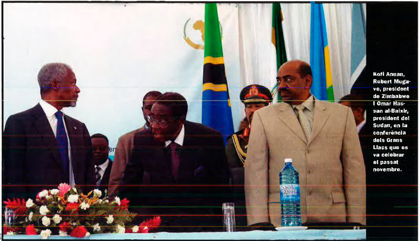
Kofi Annan, Robert Mugabe, president de Zimbabwe i Omar Hassan al-Bashir, president del Sudan, en la conferència dels Grans Llacs que es va celebrar el passat novembre.

res i senyors, hem entrat al tercer mil·lenni travessant un portal de foc.”