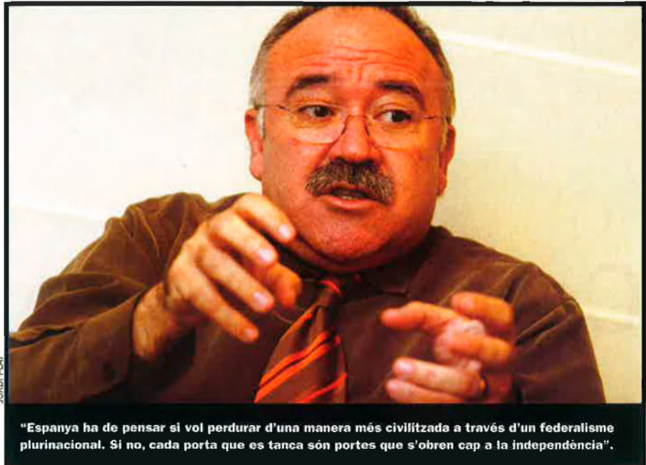
"Espanya ha de pensar si vol perdurar d'una manera més civilitzada a través d'un federalisme plurinacional. Si no, cada porta que es tanca són portes que s'obren cap a la independència".

—No té sentit plantejar-se coses que no han passat. Tenim un govern que es