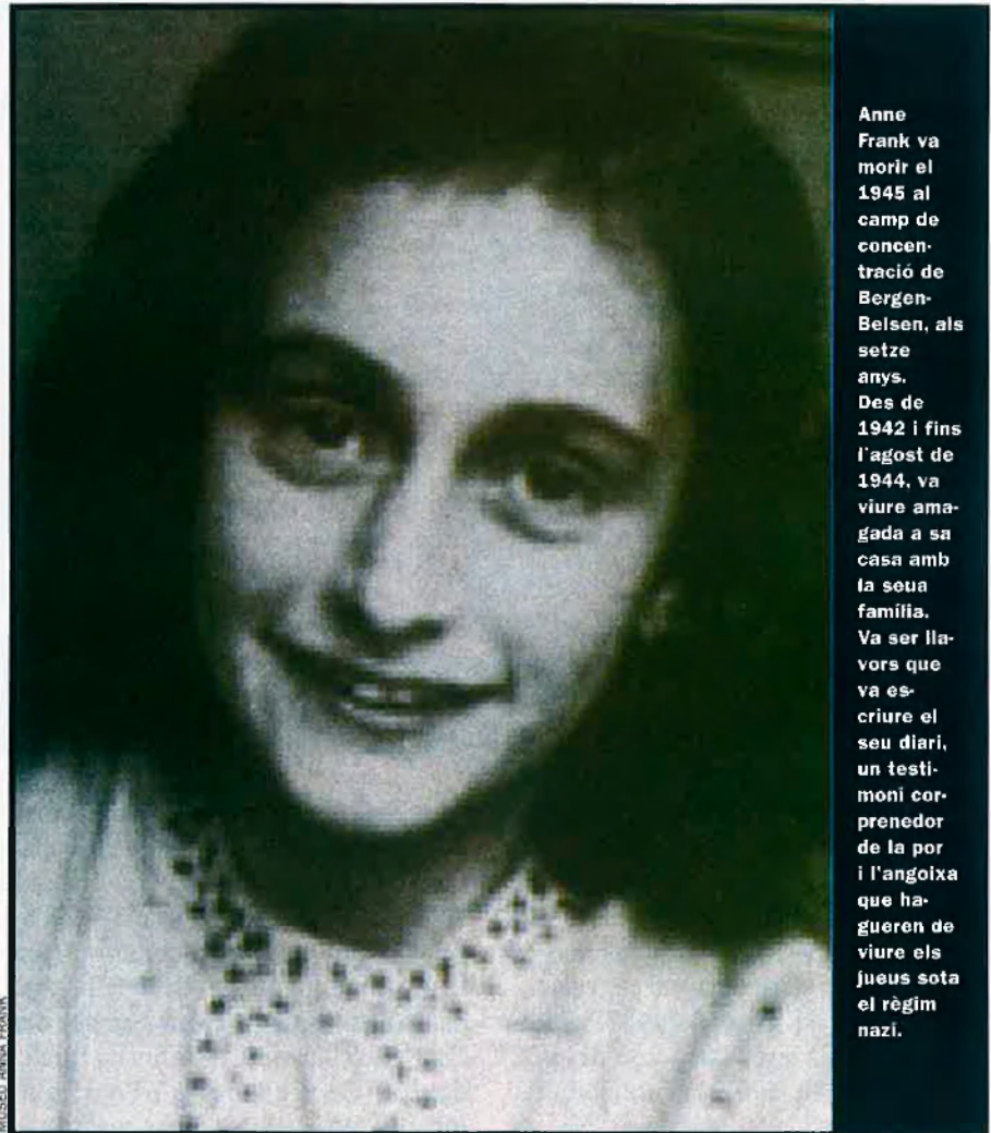
Anna Frank va morir el 1945 al camp de concentració de Bergen-Belsen, als setze anys. Des de 1942 i fins l'agost de 1944, va viure amagada a sa casa amb la seua família. Va ser llavors que va escriure el seu diari, un testimoni correnedor de la por i l'angoixa que hagueren de viure els jueus sota el règim nazi.

Després de passar pels camps de concentració de Westerbork i Auschwitz, Anna Frank va morir a Bergen-Belsen el 12 de març de 1945. Dels quatre membres de la família, només Otto Frank va sobreviure a la barbàrie nazi. Gies i Voskuijl li lliuraren el diari de la seua filla i Otto, animat pels seus amics, pren la determinació de fer una recopilació dels escrits d'Anna i publicar-los sota el títol que la mateixa xiqueta havia triat: La casa de darrere . La primera edició gaudeix d'un èxit inesperat, tot i que només s'hi imprimiren 1.500 exemplars. Durant els anys següents, el diari d'Anna Frank es tradueix a seixanta idiomes, entre ells el català, i es converteix en un dels llibres més llegits arreu del món.