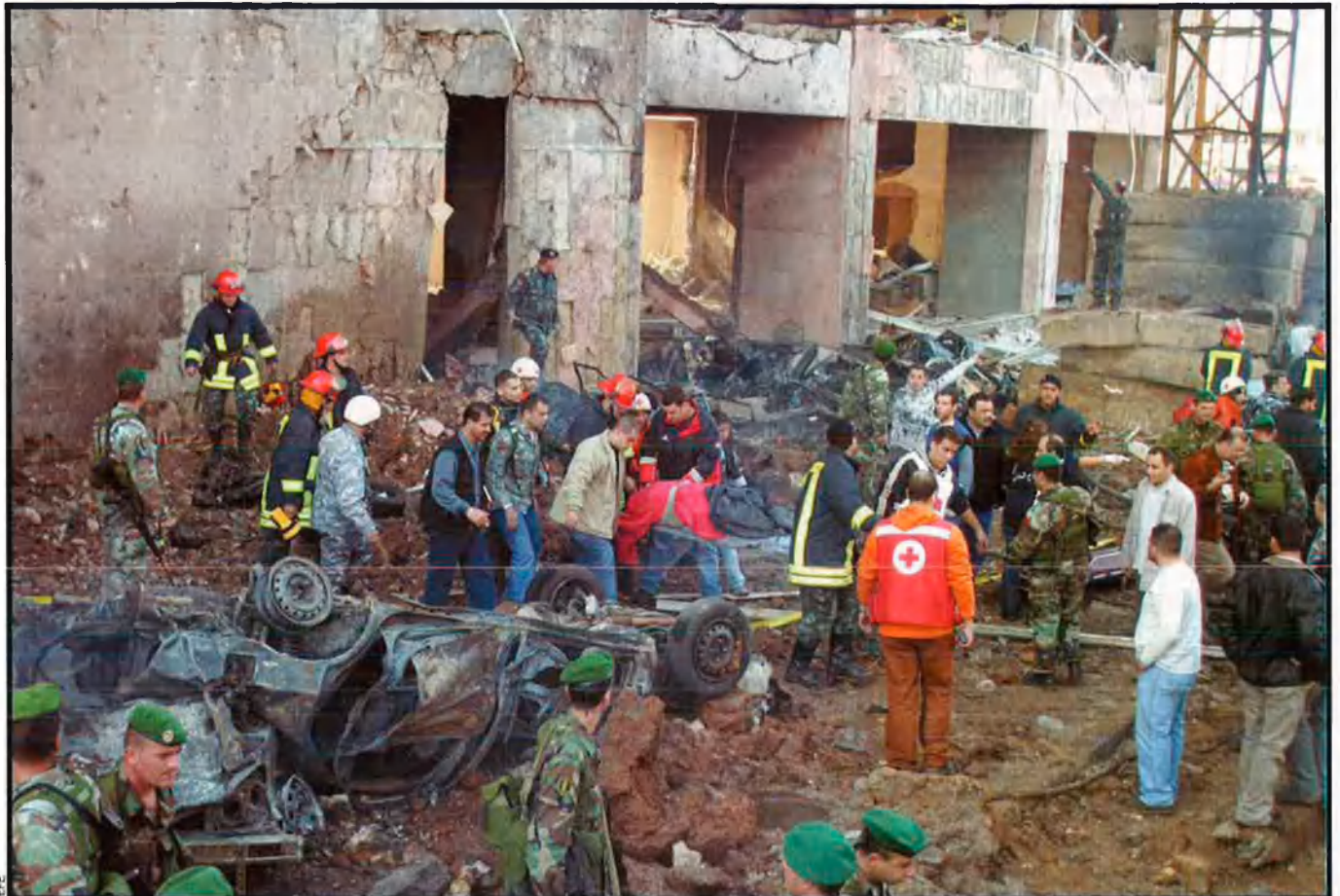
L'atemptat contra Al-Hariri podria empitjorar el clima polític al Pròxim Orient. Però també és cert que la setmana passada es va produir una insòlita manifestació d'intel·lectuals a Damasc per exigir la sortida de les tropes sirianes del Líban.

inclou el Líban en la llista de països que donen suport al terrorisme si no canvia de posició respecte a Hezbol·lah. El rotatiu àrab recull les declaracions fetes en aquest sentit per l'ambaixador nord-americà a Beirut poc després de la recent reunió entre el primer ministre libanès, Omar Karami, i Nasrallah, líder de Hezbol·lah. El mateix diari citava fonts de Damasc segons les quals els EUA i França han demanat a l'Iran que deixi de donar suport a la guerrilla libanesa a canvi d'alleugerir la pressió internacional sobre Teheran generada pels suposats plans iranians de desenvolupament d'armes nuclears. Alhora, Washington manté la pressió sobre Damasc perquè retiri els seus 16.000 soldats del Líban d'acord amb la resolució 1.559 del Consell de Seguretat i, sobretot, perquè desmantelli el Servei de Reconeixement Sirià i la Intel·ligència General Libanesa, que controlen la vida política del país.