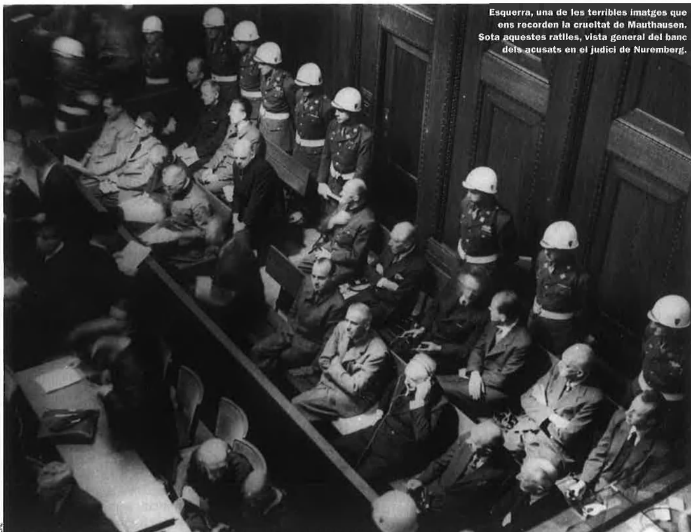
Esquerra, una de les terribles imatges que ens recorden la crueltat de Mauthausen. Sota aquestes ratlles, vista general del banc dels acusats en el judici de Nuremberg.