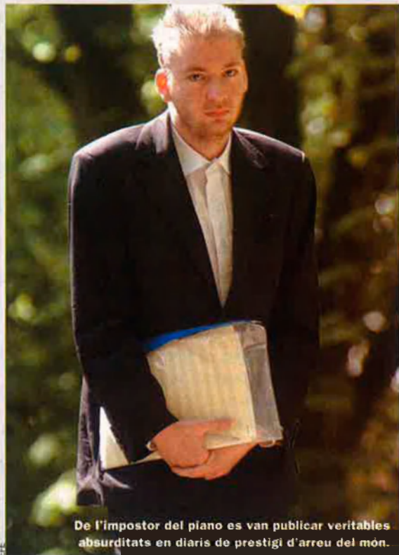
De l'impostor del piano es van publicar veritables absurditats en diaris de prestigi d'arreu del món.

Ara és "un homosexual alemany fill de grangers que havia treballat tenint cura de malalts mentals". Com a personatge, no està gens malament: és intercanviable amb l'anterior. De segur que es pot tornar a fabular una altra història. Endavant, doncs! Però que ningú oblidí que la suma de totes aquestes imbecilitats provoca un enorme descrèdit dels mitjans de comunicació, que són una pota essencial del sistema democràtic.