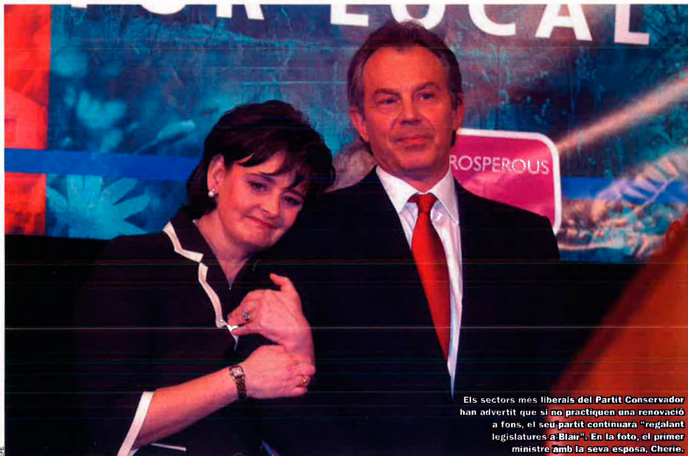
Els sectors més liberals del Partit Conservador han advertit que si no practiquen una renovació a fons, el seu partit continuarà "regalant legislatures a Blair". En la foto, el primer ministre amb la seva esposa, Cherie.

membres del gabinet de Michael Howard, hi provaren sort.