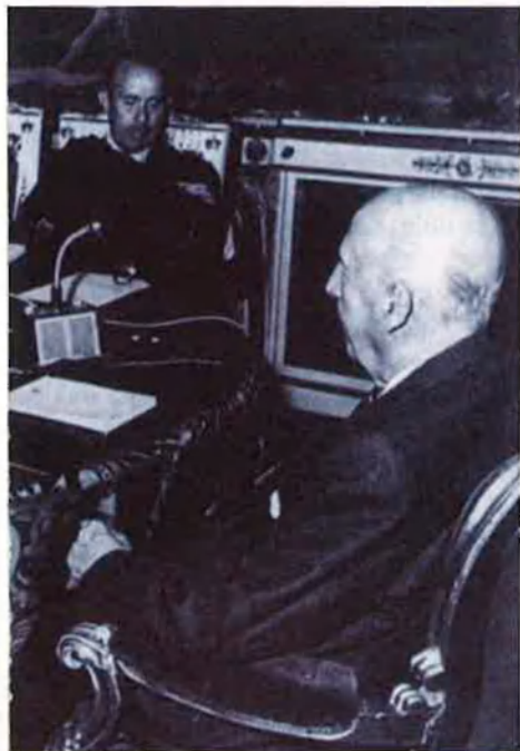
El dictador Francisco Franco, presidint un dels seus darrers consells de ministres. En una d'aquestes reunions, el 26 de setembre de 1975, el Govern donava a conèixer l'enterade, és a dir, el vistiplau a la decisió dels consells de guerra.