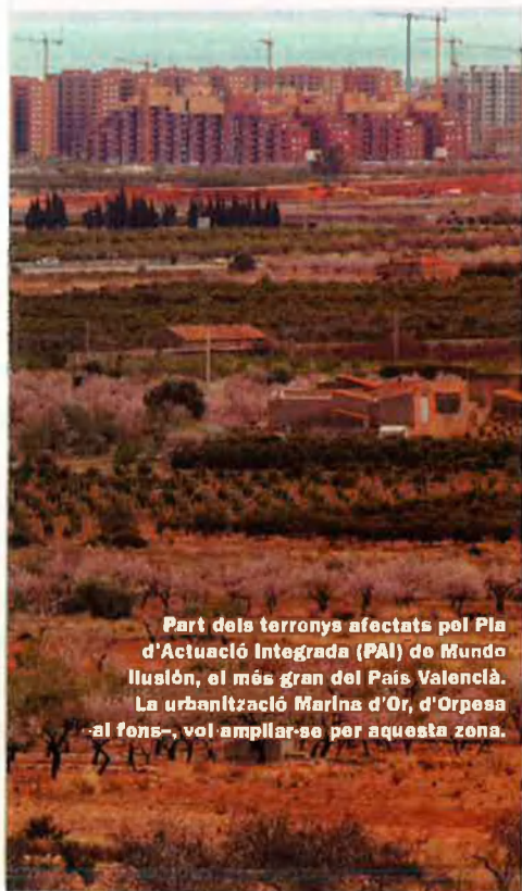
Part dels terrenys afectats pel Pla d'Actuació Integrada (PAI) de Mundo Ilusión, el més gran del País Valencià. La urbanització Marina d'Or, d'Orpesa al fons, vol ampliar-se per aquesta zona.

Lubasa, però, no va quedar-se de braços creuats. Tres dies abans de celebrar-se el ple, presentava davant el jutjat contenciós administratiu número 2 de Castelló una denúncia per presumptes irregularitats en el procés d'adjudicació. Demanava la nul·litat del procés i la