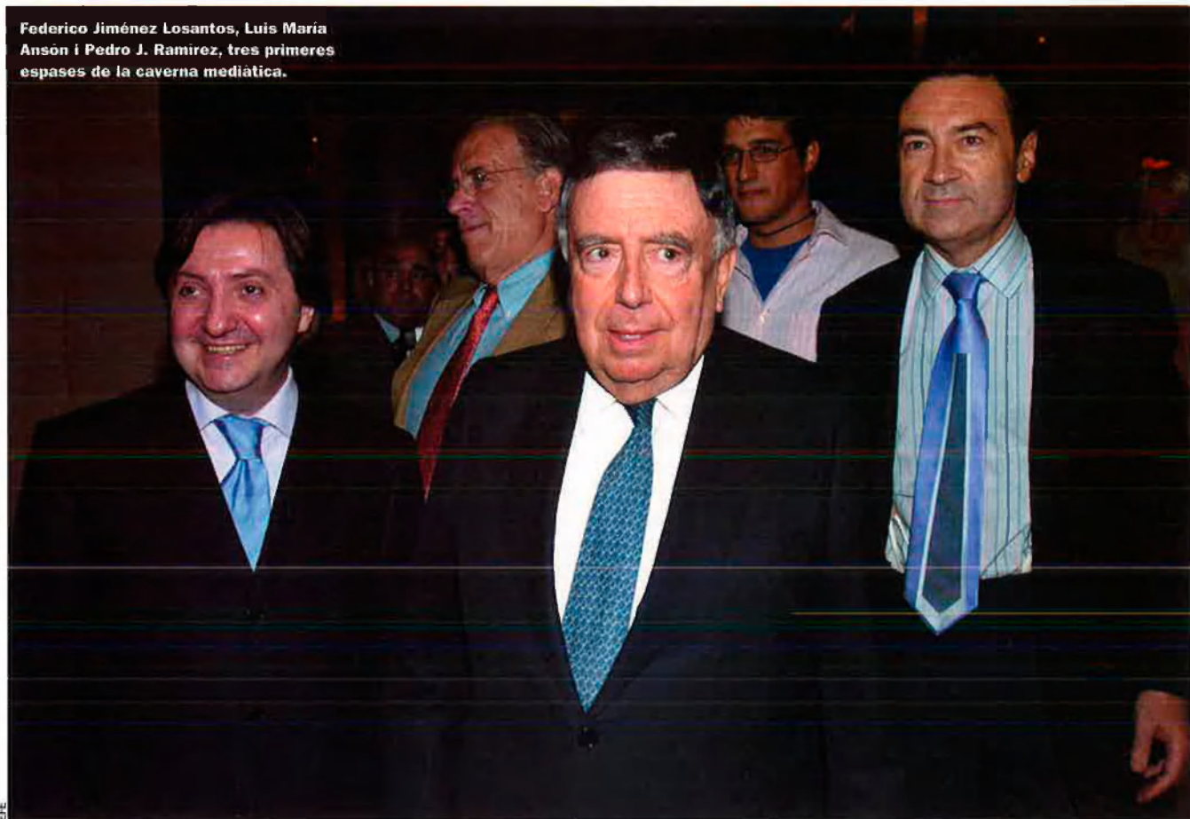
Federico Jiménez Losantos, Luis María Anson i Pedro J. Ramírez, tres primeres espases de la caverna mediàtica.

L'Estatut català ha rebut des d'Espanya tota mena d'atacs en el front polític, sindical, empresarial i social. Però la pluja de pedres que aventurava fa tres setmanes aquest setmanari ha estat especialment dura i intensa en el front mediàtic, sobretot en l'àmbit audiovisual, el que té més incidència en l'opinió pública espanyola.