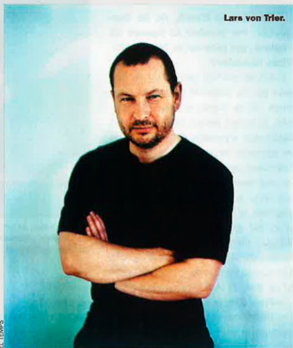
Lars von Trier.

El cinema danès no ha provat de competir ni d'imitar el cinema americà, ni les grans cinematografies europees com la francesa, sinó que ha apostat amb èxit per introduir una identitat pròpia, petita però sòlida, enmig dels gegants. Per això només ha calgut comptar amb l'insigne precedent de Dreyer i amb grup reduït de cineastes actuals (els reunits entorn del moviment Dogme'95: les etiquetes grupals de vegades són ben eficaces per superar obstacles de difusió) capaços d'oferir una proposta pròpia i ben diferenciada, i el resultat obtingut ha estat el reconeixement del cinema danès com a referència de prestigi, capaç alhora de generar expectatives comercials força bones. Ja que tant ens agrada de comparar-nos-hi, sembla que tindríem aquí un model força clar a seguir. I no solament en relació amb el cinema, em permeto d'afegir.