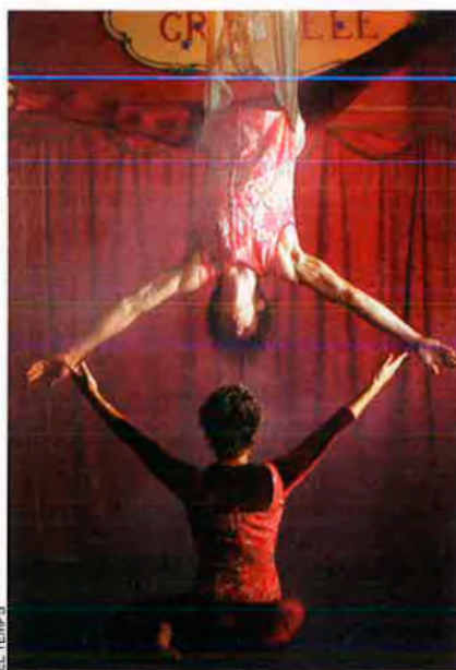
Enguany, el Circ Gran Fele i el MuVIM s'han agafat de la mà amb el propòsit comú d'oferir una porció d'il·lusió.

circ, el seu circ, em guanya, de manera aclaparadora i sense escapatòria possible, la síndrome de Peter Pan. Tinc el convenciment que es tracta d'una síndrome latent en tothom, l'enyor d'una