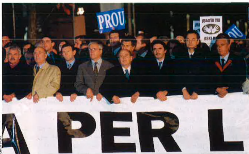
El novembre de l'any 2000, amb motiu de la manifestació per l'assassinat d'Ernest Lluch, la premsa va ser unànime amb la xifra d'assistents: 1 milió de persones.

dedica a fer recomptes de les grans manifestacions, no és la correcta. "Els mitjans no fan la feina ben feta. S'ha d'explicar què passa, no dir-ho a través