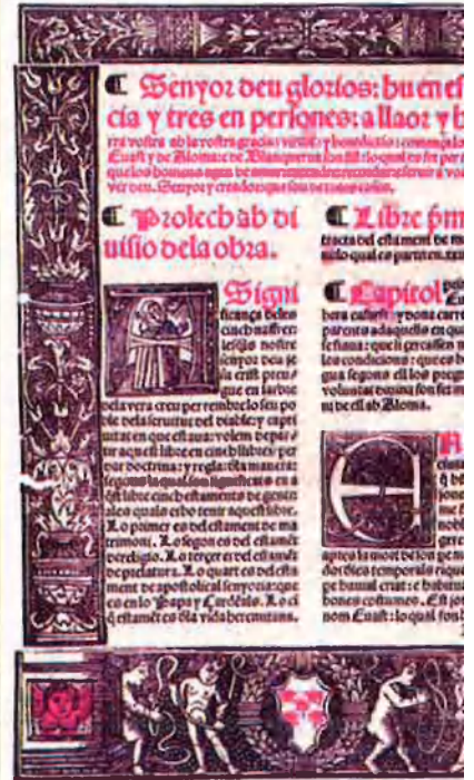
A l'esquerra, escrit del rei Alfons el Magnànim adreçat, el 14 de maig del 1432, al cardenal de Lleida Domènec Ram i el bisbe de València, Alfons de Borja. A la dreta, primera plana del Llibre d'Evast e Blanqueria , de Ramon Llull, edició del 1521 impresa a València.