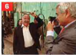
6 20 maig 2005

El cas Carmel cueja. En ple debat al Parlament, Maragall acusa CiU de corrupció amb la coneguda frase: "Vostès tenen un problema, que es diu 3%." La crisi acaba tancant-se en fals, sense cap tipus de conseqüència.