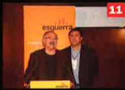
11 3 maig 2006