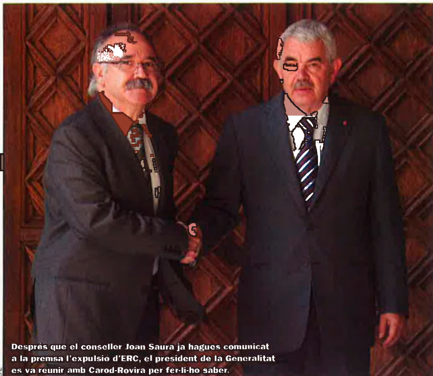
Després que el conseller Joan Saura ja hagues comunicat a la premsa l'expulsió d'ERC, el president de la Generalitat es va reunir amb Carod-Rovira per fer-li-ho saber.