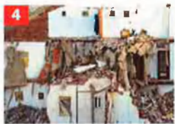
4 27 gener 2005

S'obre una greu crisi dins el Govern a causa de l'esfronament d'un túnel de les obres d'ampliació del Metro al barri del Carmel, que deixa en dubte el sistema de contractació de l'obra pública i situa en l'epicentre de la crisi el conseller de Política Territorial i Obres Públiques, el socialista Joaquim Nadal.