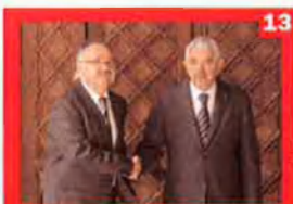
11 maig 2006

La broma de Maragall amb Carod-Rovira i Castells, que es van col·locar una corona d'espines en un viatge oficial a Israel mentre el primer els fotografiava, genera polèmica entre certs sectors que consideren que l'acte és una falta de respecte.