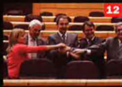
12 10 maig 2006

Les bases d'ERC rebutgen la proposta de la direcció del partit que demanava el "vot nul polític" al referèndum de l'Estatut, i es decanten obertament i unànimement pel no. Els dirigents d'Esquerra rectifiquen i el consell nacional del partit aprova demanar el vot contrari al text.