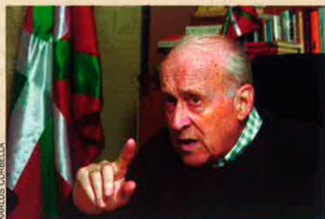
L'expresident del PNB, Xabier Arzalluz. El nacionalisme basc sempre ha utilitzat l'alt índex d'abstenció al referèndum de la Constitució al País Basc per rebutjar la carta magna espanyola.

S'ha comentat diverses vegades, en fer referència a la consulta popular del 1978, que els bascos van votar contràriament a la Constitució. La realitat, però, és que el sí va obtenir més del 70% dels vots, mentre que el vot negatiu no arribava al 24%. Tot i això, és cert –i aquí és on hi ha la confusió– que l'abstenció, defensada pel PNB, –el referent polític de CiU al País Basc–, va ser altíssima (més del 55%) i que va ser l'opció de molts bascos per mostrar