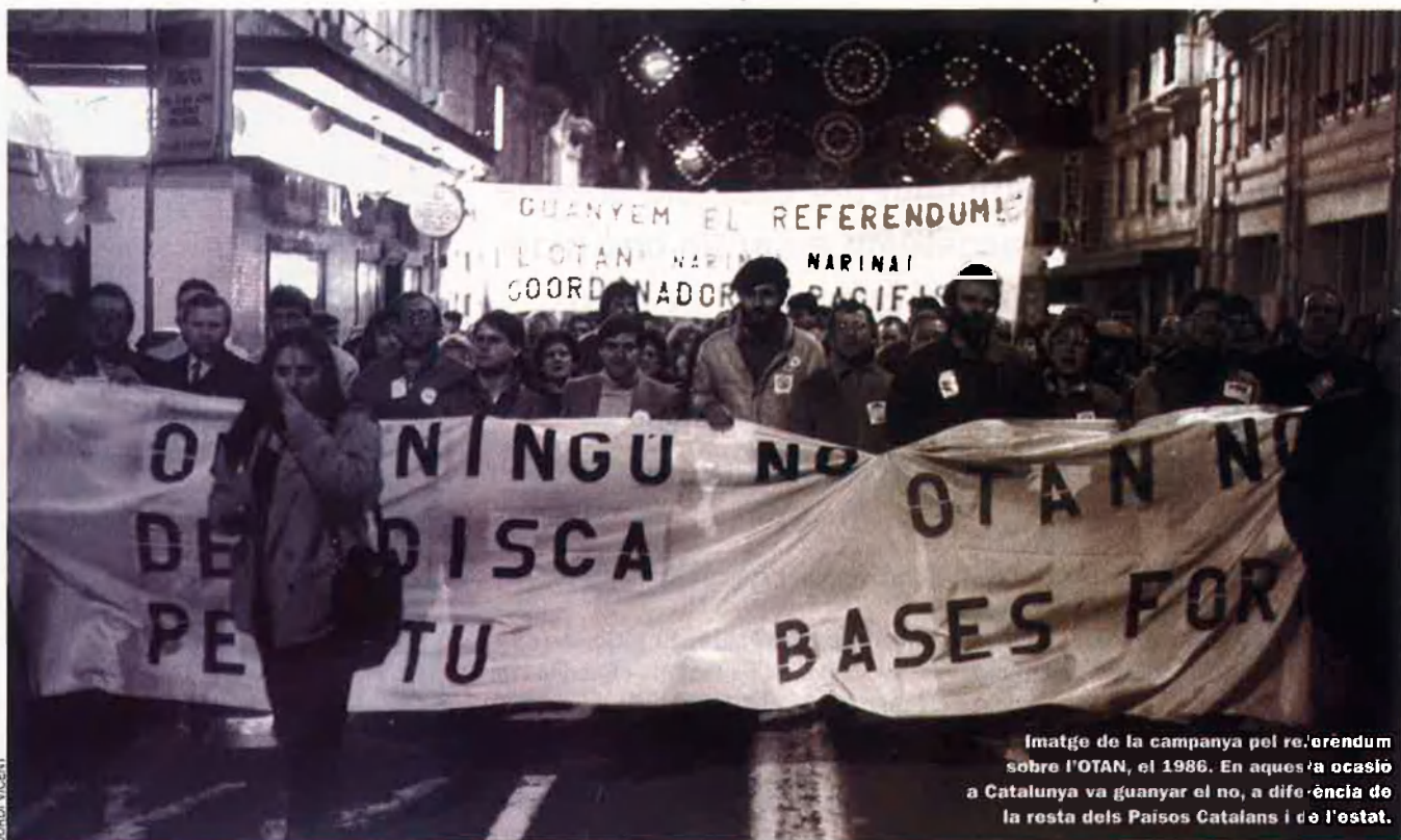
Imatge de la campanya pel referèndum sobre l'OTAN, el 1986. En aquesta ocasió a Catalunya va guanyar el no, a diferència de la resta dels Països Catalans i de l'estat.

rer el referèndum era en realitat un plebiscit al Govern de González. Davant d'aquest panorama, el resultat a Catalunya va trencar amb la dinàmica del sí mantinguda anteriorment, i un 50,6% dels vots van ser per al no a l'OTAN, enfront d'un 43,6% que va recollir el sí. Tot i això, als resultats globals de l'estat el vot afirmatiu va superar el negatiu i l'estat espanyol va continuar sent membre del Tractat de l'Atlàntic Nord.