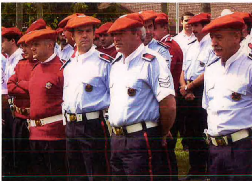
Agents de l'Ertzaintza, la policia basca. L'àmbit de la seguretat és un dels pocs aspectes en què l'autogovern català, tot i que amb retard, s'ha homologat al del País Basc.

rèndum, ho aprovin democràticament. Fins ara mai no s'ha fet ús d'aquest mecanisme, i la dreta espanyolista a Navarra, UPN, i també els sectors més jacobins del partit socialista intenten eliminar de la carta magna la disposició transitòria quarta, que obre la porta a la unió basconavarresa.