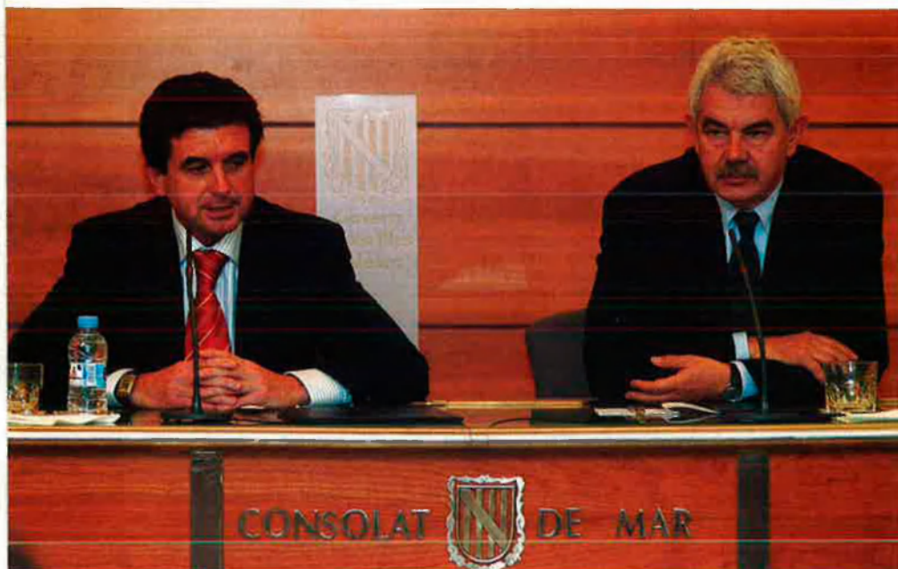
El president del Govern Balear, Jaime Matas, i el de la Generalitat de Catalunya, Pasqual Maragall. Matas opinà que l'important de l'Estatut no és la definició de la nació "sinó els doblers".

següents setmanes les posicions de socialistes i conservadors semblaren acostar-se. Tot indicava que el PP acceptava qualsevol formulació sempre que el fons fos el reivindicat. El president ho explicà clarament: "El que m'importa (de la reforma) és el què." És a dir, els diners. Com el primer dia.