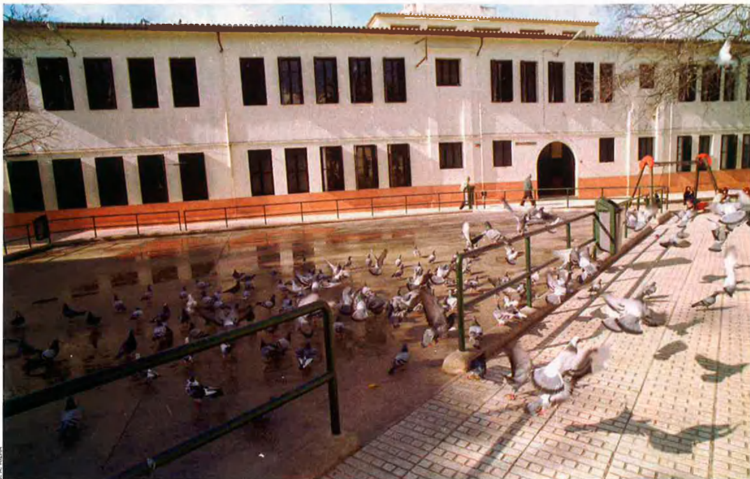
L'escola Sa Graduada ha estat declarada Bé d'Interès Cultural.

aquesta renúncia impedirà obtenir uns ingressos extraordinaris i es perdrà un 30% dels ingressos previstos inicialment per a Eivissa Centre.