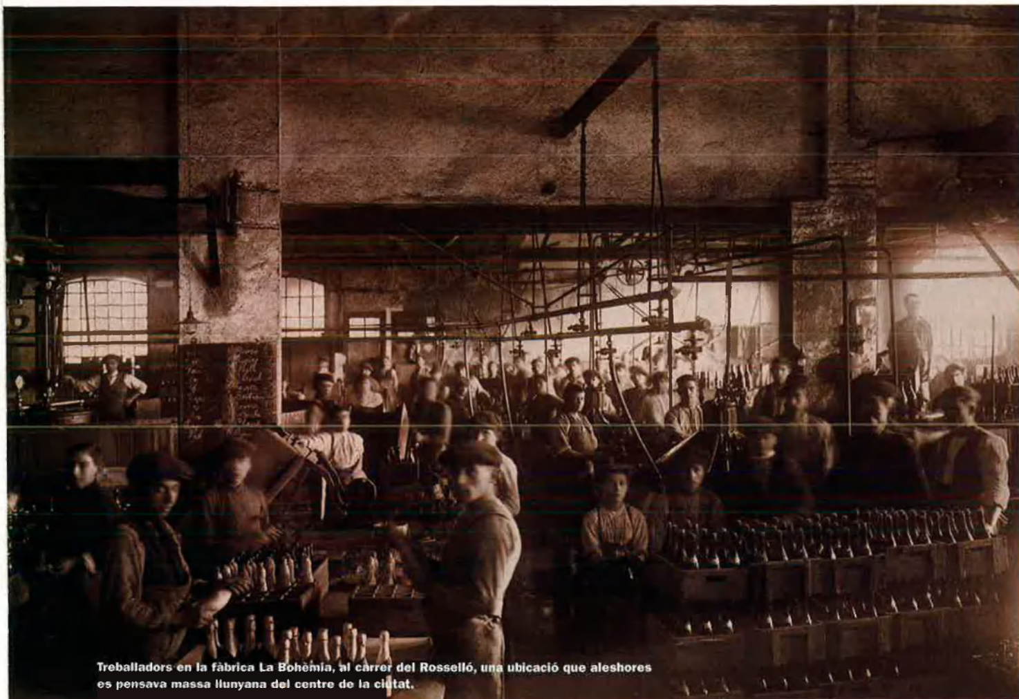
Treballadors en la fàbrica La Bohèmia, al carrer del Rosselló, una ubicació que aleshores es pensava massa llunyana del centre de la ciutat.

tita pantalla al 1970 en emissions de Televisió Espanyola. Més tard, al 1983, va aparèixer a la primera emissió de TV3. Des de llavors fins avui Damm ha fet molts anuncis que es poden veure a l'exposició "La publicitat d'una cervesa, història d'un país".