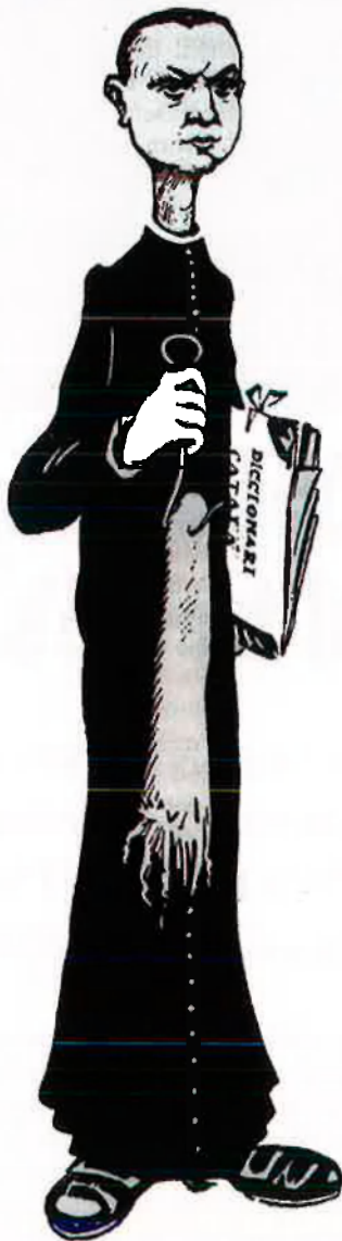
—¡Tot per la llengua catalana!