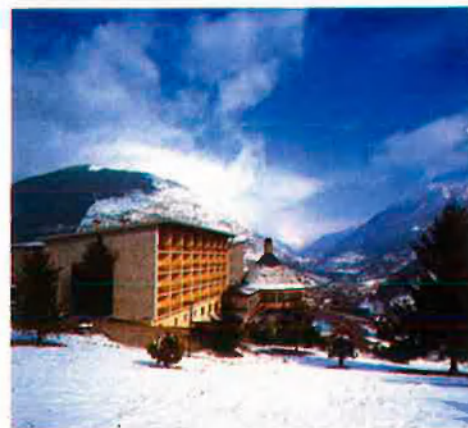
Dalt, el parador de Tortosa, i a sota, d'esquerra a dreta, els paradors de Viella, Ronda, Lleó i Cardona.

Al mateix temps, la xarxa de Paradores, amb obertures en destinacions que fins llavors passaven absolutament desapercebudes en els mapes, atreia el turisme cap a enclavaments increïbles però recòndits de la geografia de l'Espanya multiregional encara per descobrir. D'aquesta manera va sorgir o es va multiplicar el turisme en llocs com Cardona, Sos del Rei Catòlic, Bielsa, Ronda, Tortosa, Aiguablava, Chinchón, Almagro, Alarcón, Baiona, Cambados, Argómaniz, Olite..., i així fins a