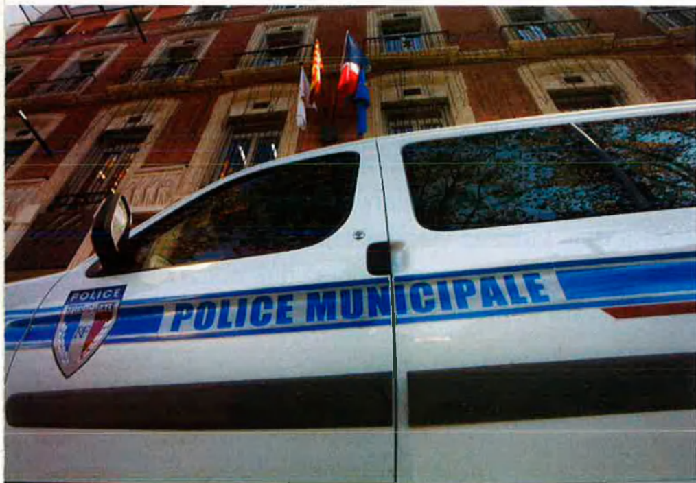
Seu del Consell General dels Pirineus Orientals. Organisme que impulsa, juntament amb la Generalitat de Catalunya, l'eurodistricte.

Això ha fet que, amb el temps, les institucions catalanes de les dues bandes de les Alberes hagin vist la necessitat de coordinar-se per trobar fórmules organitzatives que permetin superar aquestes dificultats que condicionen la vida quotidiana.