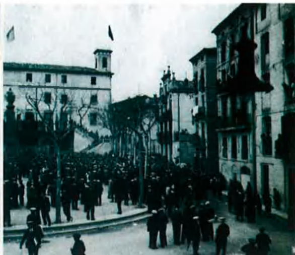
Els incidents de l'acte occitanocatalà del 16 d'abril del 1933, a la plaça de l'Ajuntament de Ripoll, on un agitador va perorar contra el nacionalisme, van ser objecte de sàtira en una vinyeta d' El Be Negre . A sota, l'escriptor Robert Lafont, autor de l'epileg de La Il·lustració occitana .