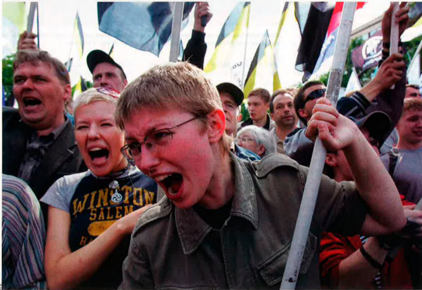
Un grup de joves del Partit Nacional-bolxevic criden consignes durant la Marxa dels Disconformes feta a Moscou l'11 de juny.

per l'ex-campió mundial d'escacs Garry Kaspàrov, el cap més visible de la coalició; la Unió Popular Democràtica Russa, de l'ex-primer ministre Mikhaïl Kassiànov, que des del congrés del partit, a principi de juny –quan va reafirmar la intenció de presentar-se a les presidencials–, s'ha desmarcat de la protesta al carrer de la coalició; Rússia Treballadora; el moviment Per una Vida Digna; i dos partits il·legalitzats fa poc: el Partit Republicà i el Partit Nacional-bolxevic, al capdavant del qual hi ha Eduard Limónov. La coalició també té el suport d'uns quants moviments defensors dels drets humans.