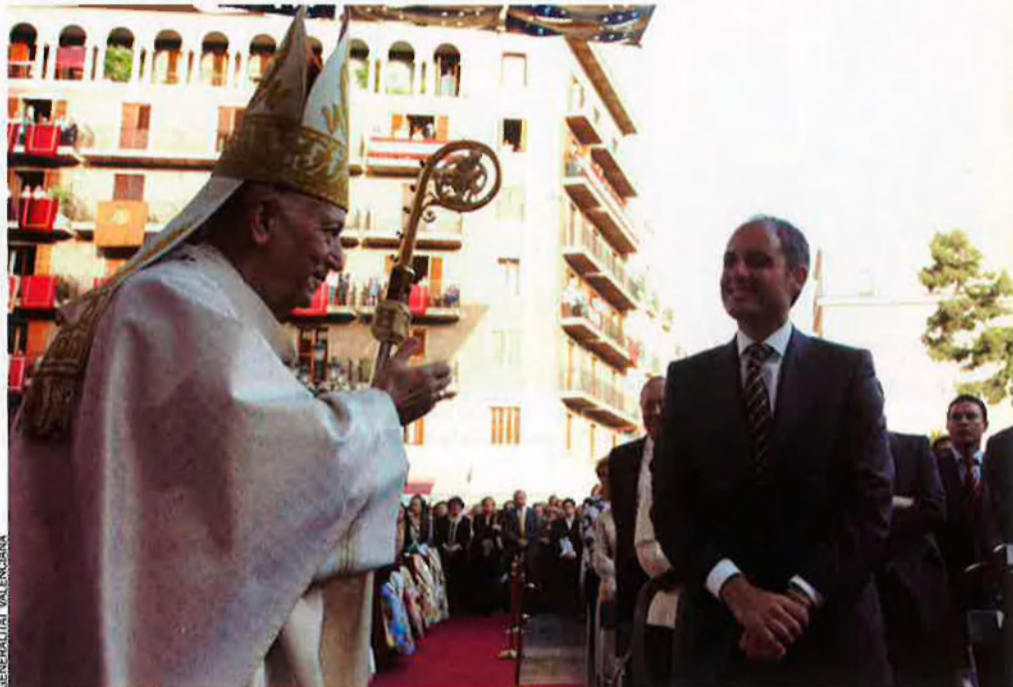
L'arquebisbe de València, Agustín García-Gasco, beneeix el president valencià, Francesc Camps. Tot i que la relació amb Zaplana era íntima, amb Camps els beneficis han estat més grans.