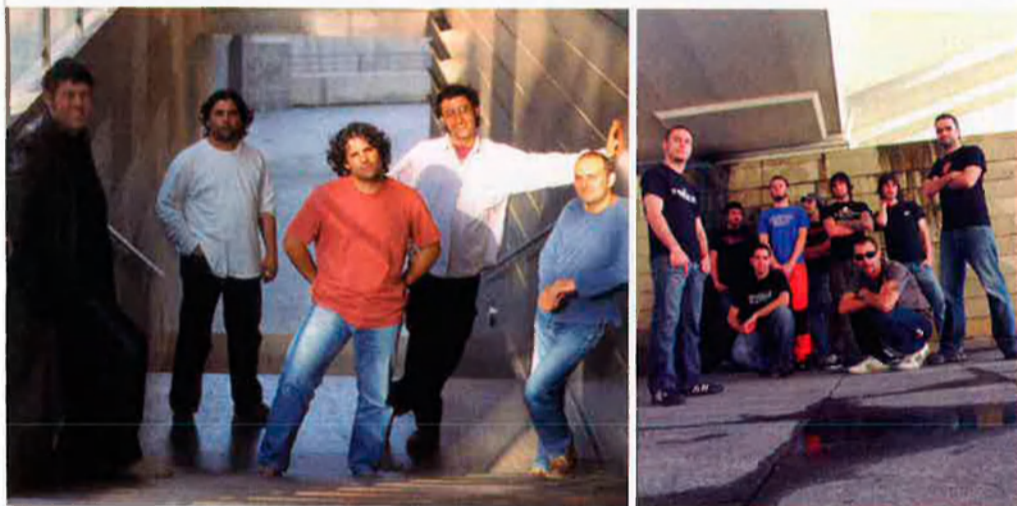
Antònia Font i Obrint Pas, dos dels grups que lideren la venda de discos en el mercat català.

La indústria discogràfica global està immersa en una gran crisi com a conseqüència de la descàrrega de música per Internet. Els Països Catalans afronten la revolució digital amb un mercat feble davant la forta pressió de les músiques anglosaxona i espanyola. A qui afecta la crisi i com reacciona la indústria?