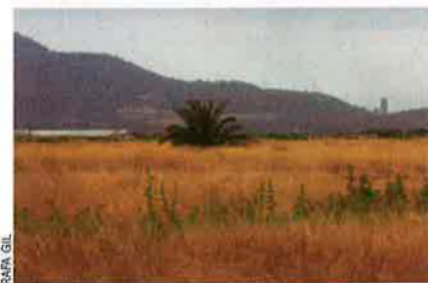
Terrenys on hi ha prevista la planta terrestre. A l'esquerra, hivernacles de conreu ecològic.

I l'epopeia no va trigar a arribar. El dia 24, el ple de l'Ajuntament aprovava per unanimitat el rebuig del projecte, al qual havia de presentar les al·legacions cor-