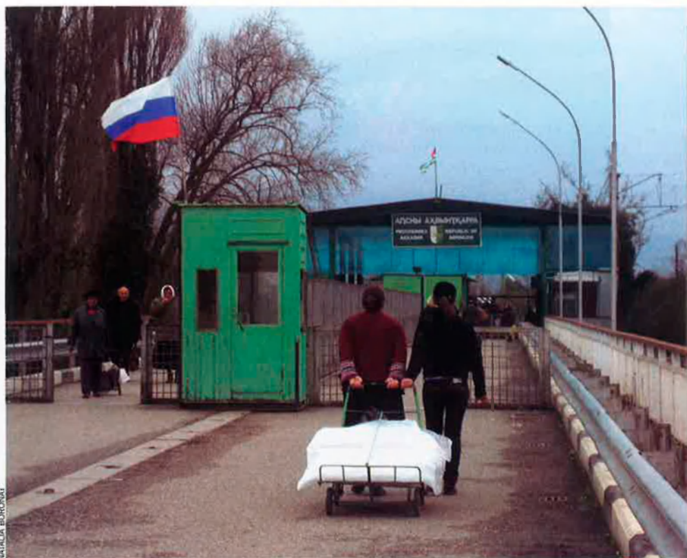
Dues noies estiren un carretó en direcció a la frontera entre Abkhàzia i Rússia.

Els abkhazos asseguren que el país s'ha recuperat molt des de la guerra,