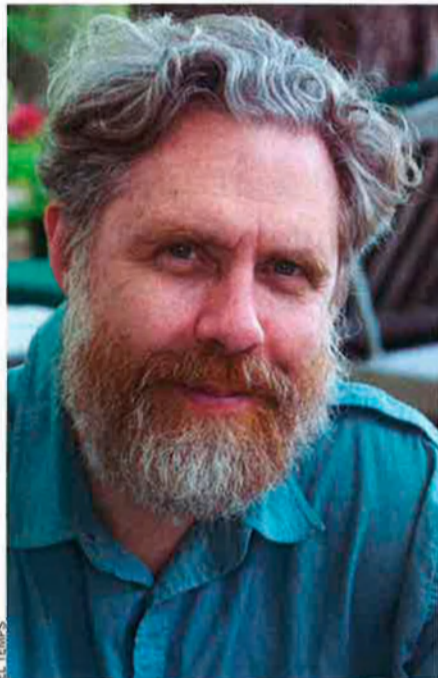
Church, el pioner de la seqüenciació. Quins gens fan els ulls blaus?

Per a respondre aquesta pregunta i més de semblants, George Church, guru de la seqüenciació a la Universitat de Harvard, ha posat en funcionament el gegantí projecte Personal Genome. El genetista vol reclutar 100.000 subjectes. Ara com ara, Church treballa amb deu voluntaris, les identitats dels quals ell mateix ignora, a qui desxifra les interessants taquetes de codi genètic per 1.000 dòlars. Aquestes cadenes d'ADN seran publicades amb nombrosos tests, fotografies de grandària de passaport i característiques mèdiques. Amb aquest projecte, Church també vol promoure un debat sobre els perills socials de la radiografia total: com es protegeixen les informacions genètiques? Poden augmentar les quotes les asseguradores a causa d'una seqüència genètica d'aspecte perillós? Es pot impedir que fragments d'ADN criminals d'un innocent condueixen al lloc dels fets? S'exigiran potser mútuament les