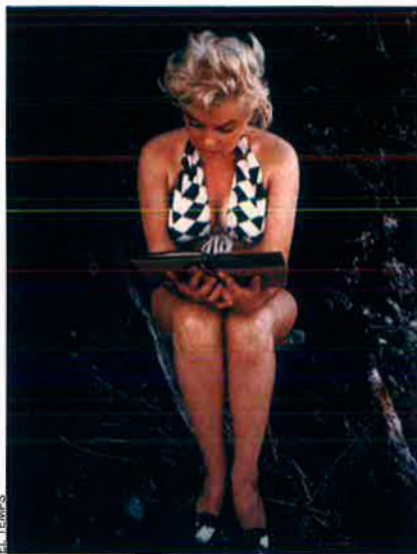
'Marilyn llegint Ulisses ': una imatge d'Eve Arnold (1952). La fotògrafa explica que, en anar a veure l'actriu, la va trobar concentrada llegint Joyce en veu alta. D'aquí ve el tema de la sessió.

"Ella no es va suïcidar: el seu psiquiatre li havia donat medicacions contradictòries"