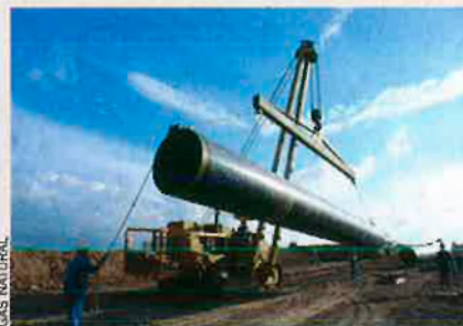
La gasista catalana fa un balanç excel·lent de l'exercici 2007 a Catalunya.

Gas Natural invertirà l'any vinent 87,3 milions d'euros a Catalunya per expandir la xarxa i fer arribar el gas a 22 nous municipis, com ara Cardona, l'Hospitalet de l'Infant i Torrelles de Llobregat. Amb la incorporació, enguany, de 70.000 nous clients, la companyia catalana ha superat els 2 milions de clients. Aquesta xifra és una fita important per a Gas Natural, que ha duplicat la cartera de clients a Catalunya des del 1991, dels quals prop del 50% ja són al mercat liberalitzat. Gas Natural també ha començat els tràmits per a portar el subministrament