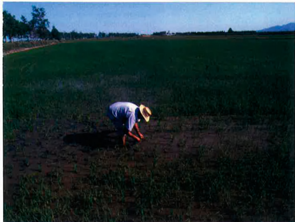
Dins el sector primari, l'agricultura és l'àmbit que va créixer més durant l'any passat, segons l'Anuari Econòmic Comarcal.

L'economia catalana consolida un procés de recuperació que ja va engegar l'any 2003 i accelera el creixement de l'activitat econòmica amb un avanç del 3,71% del PIB a preus bàsics. Per situar-se en aquesta posició ha controlat els efectes recessius de l'enduriment de la política monetària, les alces de preus dels productes energètics i de més béns i la revaloració de l'euro, i ha mantingut l'empenta dels darrers anys. Tot plegat ha conduït Catalunya a una expansió de l'activitat econòmica d'un 19,1% des de l'any 2000, com constata l'Anuari Econòmic Comarcal 2007 de Caixa Catalunya.