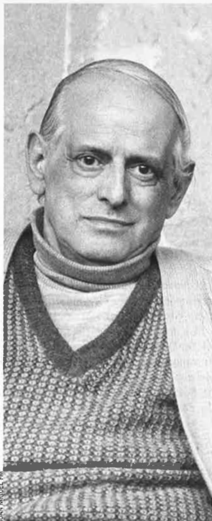
L'obra de Blai Bonet, gulada pel domini de la llengua, traspuja una formació molt sòlida.

L'Obra Cultural Balear reté homenatge al prolífic i genial escriptor mallorquí desaparegut el 21 de desembre de 1997.