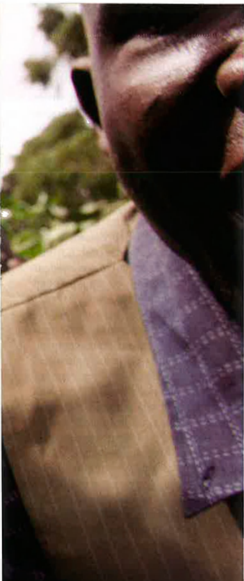
Un grup de seguidors de l'oposició mostren una fotografia del seu líder, Raila Odinga, al barri de Kibera, a Nairobi, la capital de Kenya, durant les protestes desfermades després de les eleccions del mes passat.

obtenir les reformes que havien estat promeses repetidament.