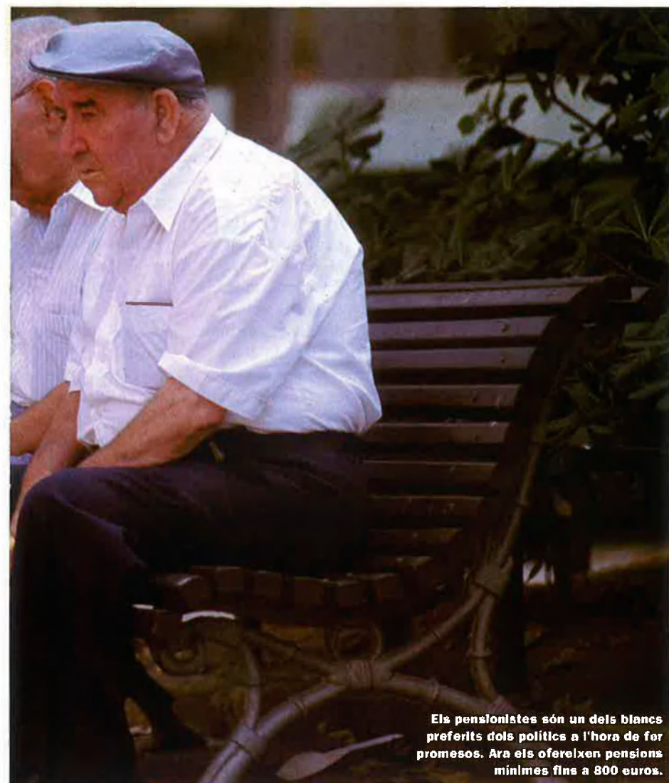
El pensionistes són un dels blancs preferits dels polítics a l'hora de fer promeses. Ara els ofereixen pensions mínimes fins a 800 euros.

la supressió de l'impost sobre patrimoni i actes jurídics documentats, un impost que només conserven els estats francès i espanyol, i que té el rècord de ser el més elevat de tot el món: des del 0,20% fins al 2,5% del valor. En aquest capítol, PSOE, PP i CiU defensen la derogació de l'impost, que representa per a l'estat uns ingressos anuals de 1.400 milions d'euros, "una càrrega perfectament assumible per a la caixa de l'estat", explica José Maria Tovillas.