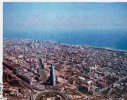
Barcelona, ben valorada per als negocis.

Barcelona obté bona nota com a ciutat per als negocis, inversió estrangera, producció científica, qualitat de vida o salaris, entre més paràmetres que mesuren la competitivitat de les ciutats europees. Si els salaris són dels més baixos de l'Europa occidental, el cost de la vida se situa en el lloc 31 d'un total de 143 ciutats estudiades. Això es desprèn de l'Observatori elaborat per l'ajuntament i la Cambra de Comerç. La capital catalana manté el primer lloc en qualitat de vida per als treballadors. Però la ciutat ha d'avançar en el sector terciari i no viure només del comerç i