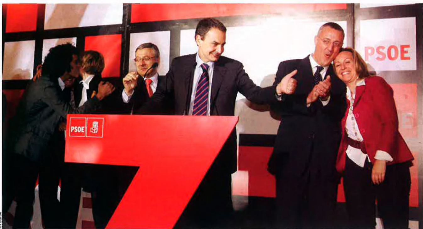
José Luís Rodríguez Zapatero es manté arreu de l'estat espanyol però guanya a Catalunya.