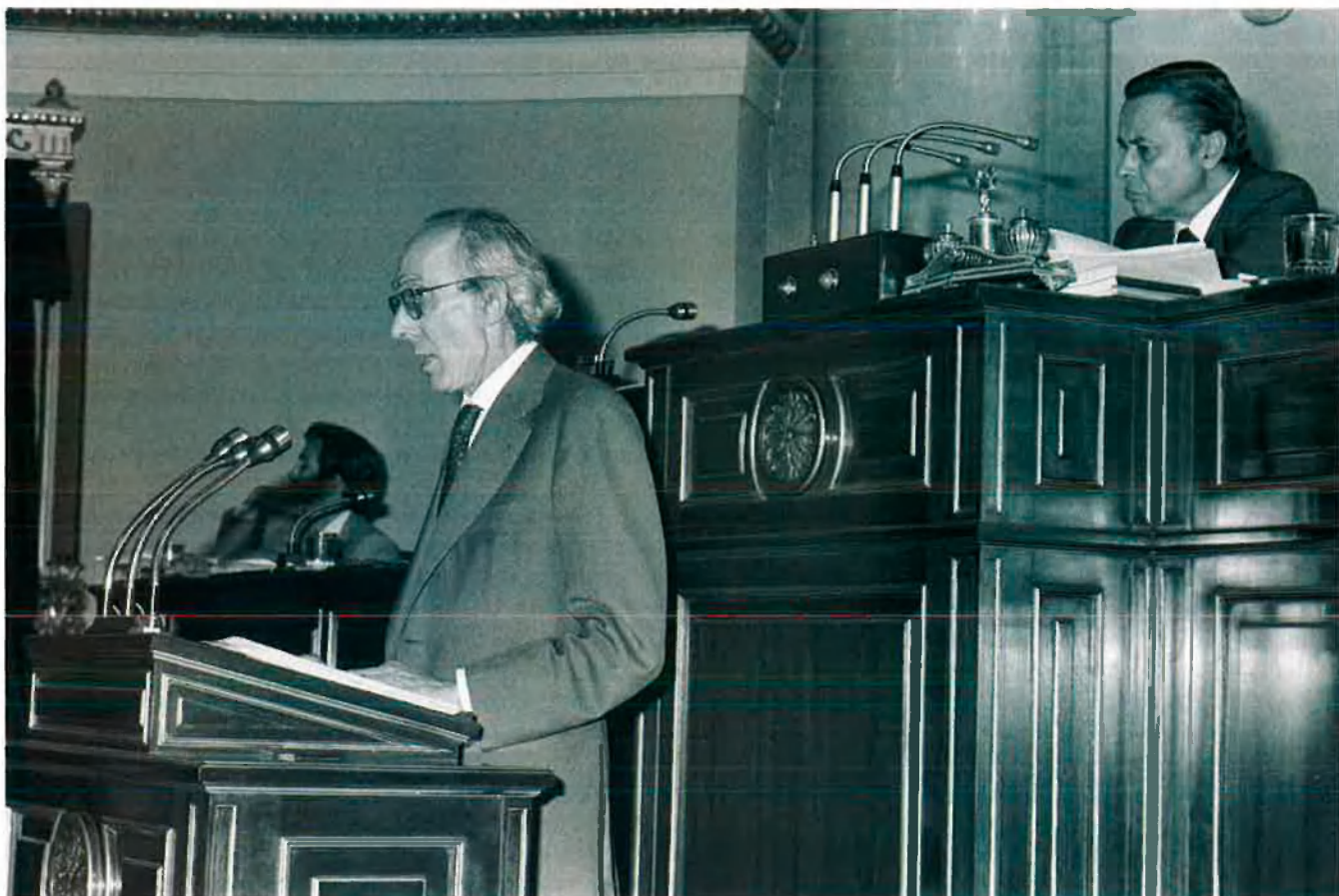
El senador Josep Benet durant una intervenció en una sessió plenària del Senat, presidida per Cecilio Valverde (darrere seu), el juny del 1982.