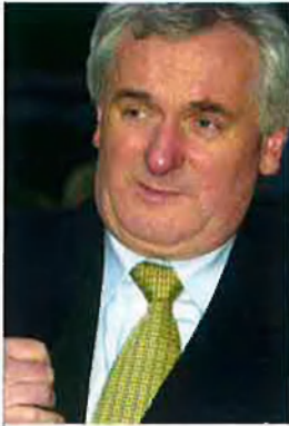
Bertie Ahern Primer ministre d'Irlanda. Va fer un paper mediador i va renunciar a la reivindicació històrica sobre els comtats de l'Ulster.