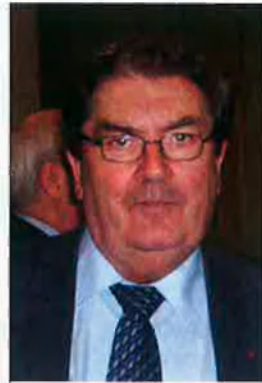
John Hume Líder dels socialdemòcrates. És considerat l'arquitecte del procés que va permetre el pacte. Premi Nobel de la pau.