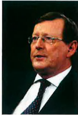
David Trimble Líder dels unionistes. Va aconseguir que els protestants s'avinguessin a la pau amb els catòlics. Premi Nobel de la pau.