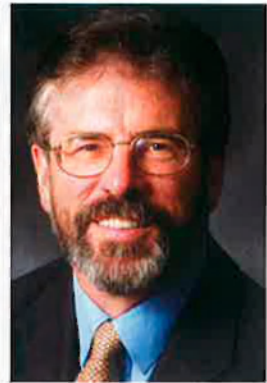
Gerry Adams Líder del Sinn Féin. Va tenir un paper destacat a aconseguir la renúncia de l'IRA a les armes i en l'acceptació de la policia.