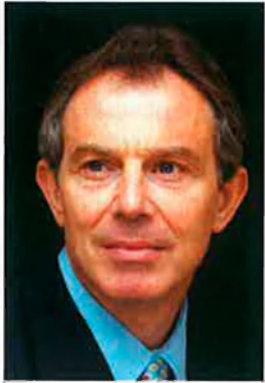
Tony Blair Com a primer ministre del Regne Unit va renunciar a continuar governant l'Ulster.