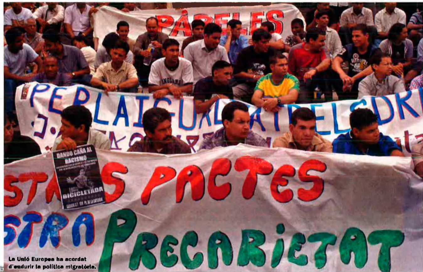
La Unió Europea ha acordat d'endurir la política migratòria.

La setmana passada, els governs de la Unió Europea van acordar d'harmonitzar les polítiques migratòries, sobretot els procediments d'expulsió d'indocumentats. La directiva del Retorn va despertar una polèmica immediata, perquè fou considerada "d'extrema duresa" per editorials de nombrosos mitjans. Les mesures més conegudes són la retenció dels irregulars fins a divuit mesos, la no-obligació dels estats d'oferir assistència jurídica en els procediments d'expulsió, l'equiparació, en molts casos, dels menors amb els adults i la prohibició als expulsats de tornar a territori europeu durant cinc anys.