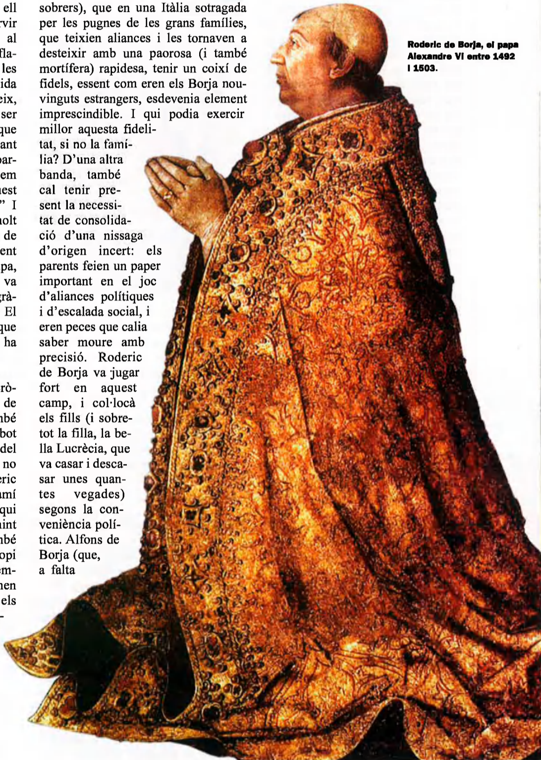
Roderic de Borja, el papa Alexandre VI entre 1492 i 1503.

de fills, utilitzava els nebots amb el mateix fi), ja havia estat un mestre de qui prendre exemple: no debades un capellà al servei d'Alfons el Magnànim havia escrit d'ell que "tant quant visqué, tot son estudi, ab gran diligència, fou augmentar en honors e riqueses a tots los seus".