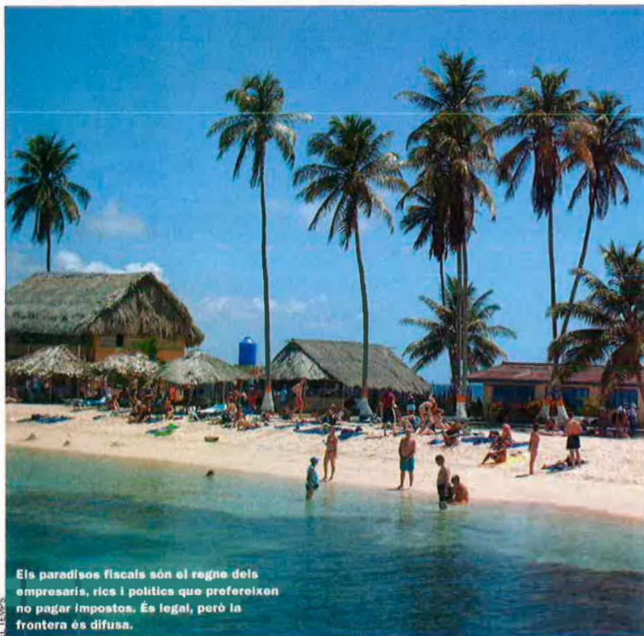
EL TEMPS Els paradisos fiscals són el regne dels empresaris, rics i polítics que prefereixen no pagar impostos. És legal, però la frontera és difusa.

bilitat política garantida constitueixen un conjunt atractiu per a les grans empreses i persones físiques amb grans patrimonis. Però també s'hi aboquen empreses amb un volum de negoci petit, entre 200 milions i 300 milions