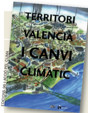
EDICIONS 96 | ACCIÓ PEL CLIMA