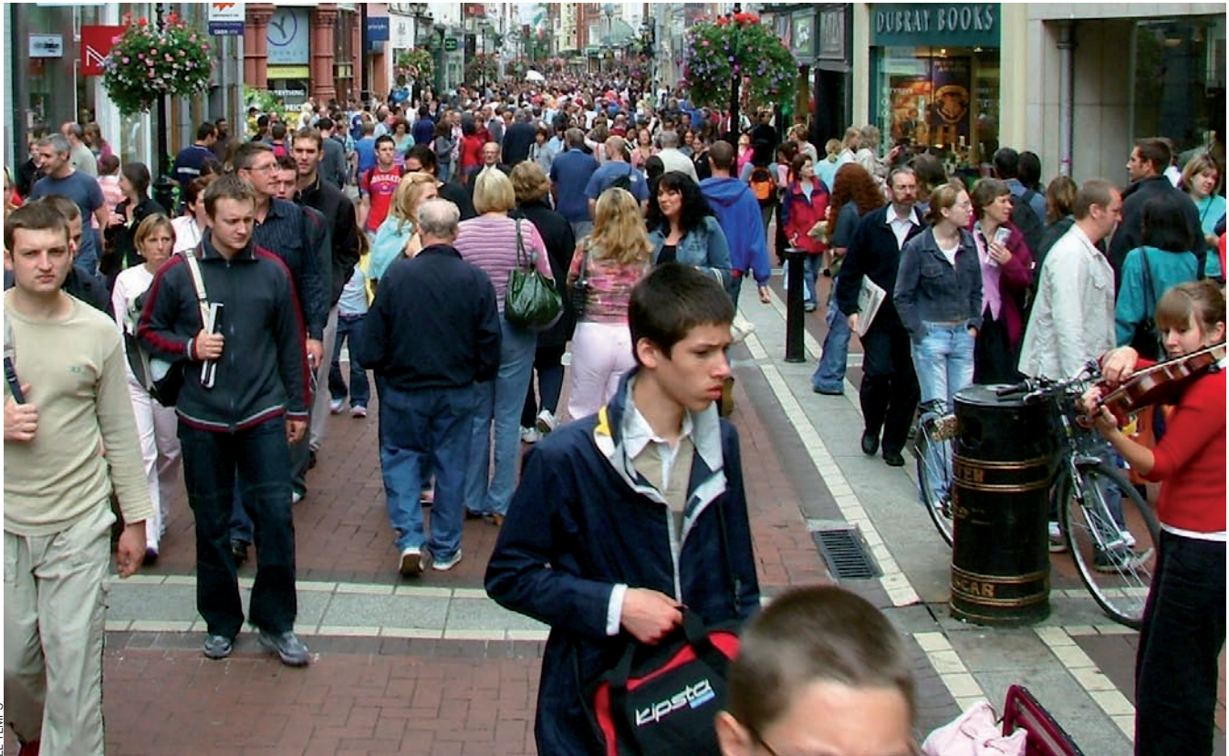
Fa 25 anys, la societat valenciana demanava una llei per a normalitzar la llengua pròpia. Ara els experts en fan una valoració.