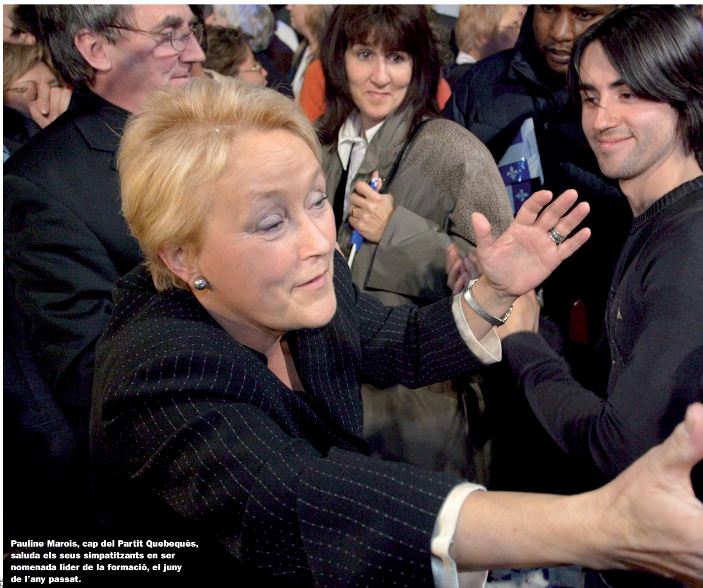
Pauline Marois, cap del Partit Quebequès, saluda els seus simpatitzants en ser nomenada líder de la formació, el juny de l'any passat.

D'una manera semblant, l'anomenat escàndol de les comandites , que va esclatar l'any 2004 quan es descobrí que el govern canadenc havia utilitzat fons públics per fer propaganda sobre la unitat del Canadà i a favor del no al referèndum del Quebec de l'any 1995, va fer pujar també els índexs de suport a la sobirania. De totes formes, val a dir també que el suport del Bloc Quebequès a un possible govern de coalició encapçalat per Stéphane Dion implicava una contradicció dins les files sobiranistes, perquè Dion, en el temps que fou ministre del govern de Jean Chrétien, va ser el responsable d'una llei sobre referèndums que pretenia posar condicionaments legals a una eventual separació del Quebec.