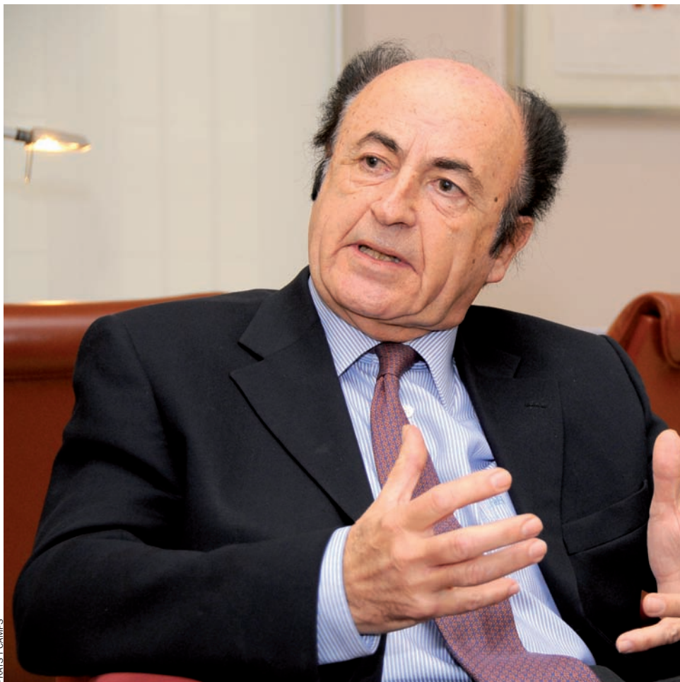
FRATS I CAMPS

—Crec que els empresaris mantenen el mateix discurs. La nostra