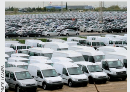
La planta de Ford a Almussafes.

Quan la millora de les vendes a Europa semblava que donaria una treva a la precària situació de les factories d'automòbils dels Països Catalans, la direcció de Ford Espanya s'ha encarregat de recordar que el sector continua essent a la corda fluixa. Els responsables de la planta d'Almussafes, on avui dia es fabriquen els models Focus i Fiesta, volen obrir un nou expedient de regulació d'ocupació (ERO) que implicaria suprimir un terç de les jornades a la planta de motors des del mes vinent fins al març del 2010. La direcció justifica la mesura per la cancel·lació d'una