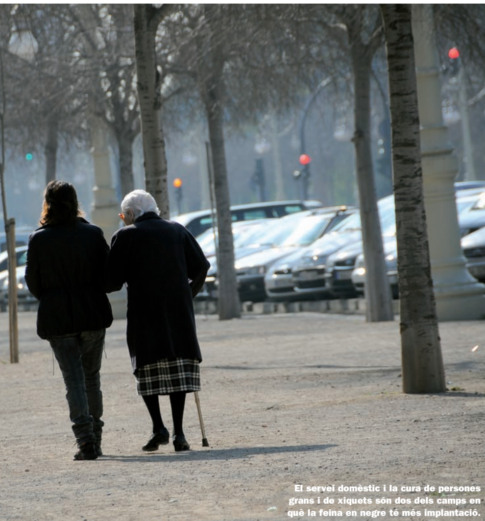
El servei domèstic i la cura de persones grans i de xiquets són dos dels camps en què la feina en negre té més implantació.

La virulència de la crisi i l'augment de la desocupació estimulen una economia submergida, per si ja molt escampada.