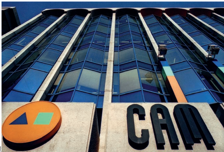
Les dues caixes valencianes, CAM i Bancaixa, ocupen el segon i el tercer lloc, respectivament, en el rànquing de caixes dels Països Catalans. La CAM ha augmentat el benefici d'un 1,2% el 2008.

Caixa Manlleu, l'entitat més petita del sistema de caixes català, també defensa la identitat i la independència de cada caixa: "La dimensió és un problema. Ara ens trobem amb inconvenients que abans afectaven només les economies d'escala. Però la solució no és la fusió, sinó les aliances entre caixes. Hem de treure suc d'allò que podem aportar mútuament les caixes si cooperem." Des de Caixa Catalunya, una entitat que sempre ha aparegut en els rumors de travesses de fusions, el seu president, Narcís Serra, assegura que no hi ha "cap previsió de necessitat d'incrementar la massa crítica per superar la crisi". La gran diferència entre Catalunya i alguns altres territoris és que en el sistema financer català el control polític és molt limitat. Seria impossible que el govern ordenés una fusió d'entitats privades. I, pel que fa a les caixes públiques, Catalunya, Girona i Tarragona, ja es va intentar, però el procés va quedar avortat de seguida. Els directius de les caixes coincideixen a assenyalar que la llei de