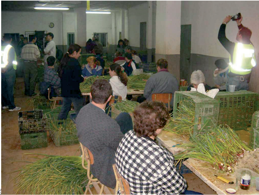
Sota l'economia submergida s'amaguen a vegades situacions d'abús que voregen l'esclavatge. El 2004, a Picassent, la policia va desarticular un taller dedicat a emmagatzemar alls tendres.

de l'agricultura, on el mecanisme de la contractació al punt d'origen ha permès de contractar i treballar amb garanties i minorar –ni que siga parcialment– el problema que implicava no disposar de mà d'obra per a les feines del camp.