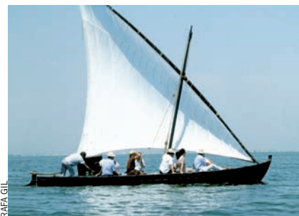
L’Albufera de València.

plaent en ajuntar-se dolçament junyits i lentament i tendra plegar-se com un puny (“lo són aquell pus extrem amador”), l’amor ben encarnat: “Amor de vós jo en sent més que no en sé/ de què la part pitjor me’n romandrà;/ e de vos sap lo qui sens vós està.” Com un Ulisses renaixut, l’universal Ausiàs Marc (el 3 de març fa 550 anys de la seua mort, entre el menyspreu quotidià), sense pors escatològiques, ja amb l’esperit despert i tocat d’humanisme, no invoca déus dels vents, ans, al contrari, ens explica precisament una venturosa navegació cap a un amor que sobreviurà a l’oblit i a mort, després d’alguna campanya militar amb el rei Magnànim, des de les costes sicilianes a les valencianes, que impossibilitarien el mestral i el ponent, però que el xaloc, bufant per babord, i el llevant per popa impel·lirien adequadament; el gregal per estribord i el migjorn de través unflaren les veles exactament com calia per a un ràpid viatge d’enamorat i,