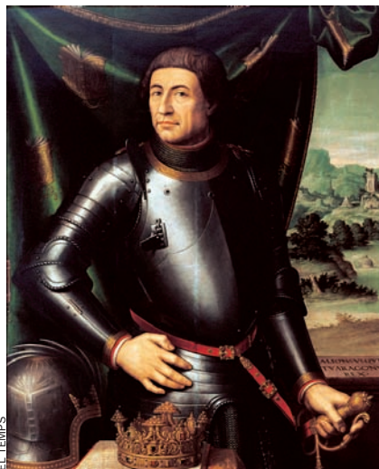
Alfons el Magnànim. L'ambient cultural de la seva cort va ser determinant per a la formació d'Ausiàs Marc.

mètrica, i abandonar l'occità com a llengua de l'art poètica.