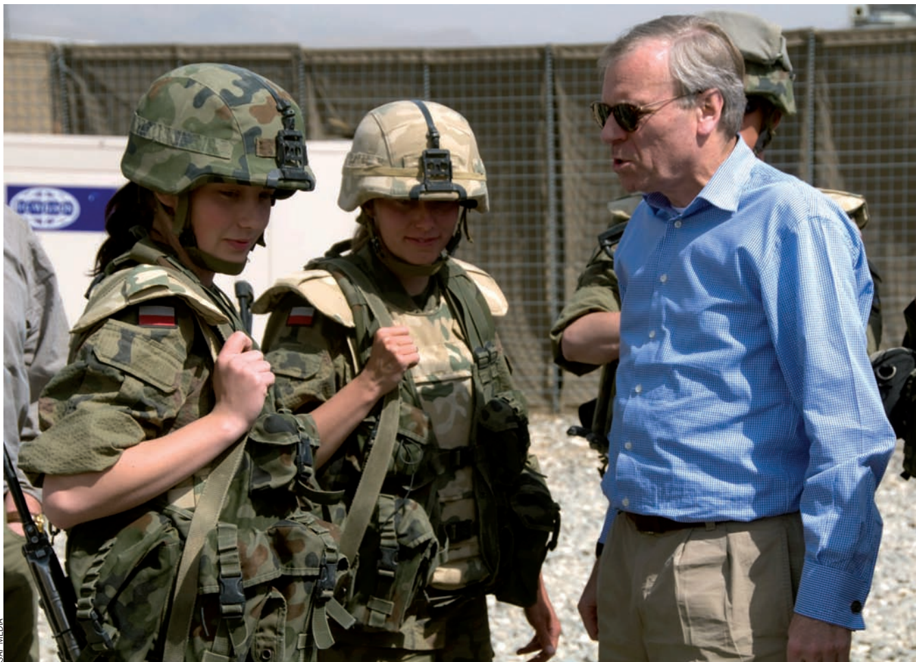
El secretari general de l'OTAN, Jaap de Hoop Scheffer, parla amb dos soldats de l'exèrcit polonès que participen a la missió de l'aliança atlàntica a l'Afganistan, durant una visita a mitjan mes de març.

bones intencions d'Obama, poc després de la presa de possessió del nou president dels Estats Units el govern de Moscou va encoratjar el president del Kirguizistan a tancar la base militar que els americans tenen en aquesta