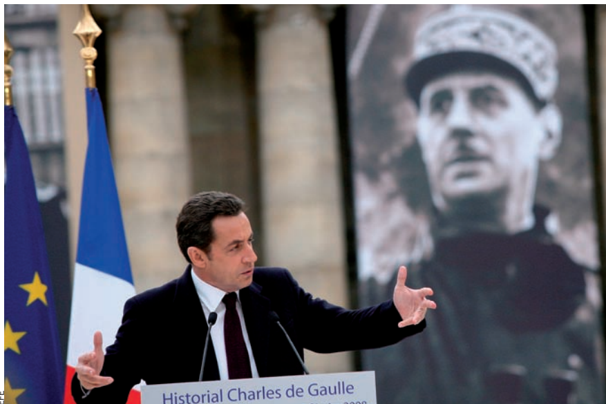
El president francès, Nicolas Sarkozy, pronuncia un discurs sota la fotografia del president Charles de Gaulle, que el 1966 va treure França de l'estructura militar de l'OTAN.