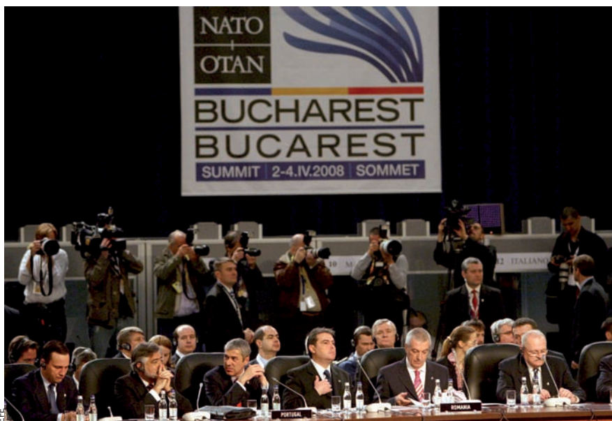
Alguns dels caps d'estat i de govern dels països que formen part de l'OTAN, a la darrera cimera d'aquesta organització, feta a Bucarest, la capital de Romania, l'abril de l'any passat.

plantegen a l'Afganistan i per aquesta raó aposten perquè l'OTAN apliqui una nova estratègia que inclogui un increment de l'ajut econòmic, l'educació i el desenvolupament d'infraestructures en aquell país asiàtic. En aquest sentit, a la conferència pronunciada a Brussel·les el mes de gener passat, el secretari general de l'organització va assenyalar l'Afganistan com el primer assumpte que l'OTAN ha de sotmetre a una revisió. Scheffer va agrair que els Estats Units estiguessin disposats a enviar més tropes a l'Afganistan, però va demanar també una contribució més gran dels països europeus, tant en el terreny