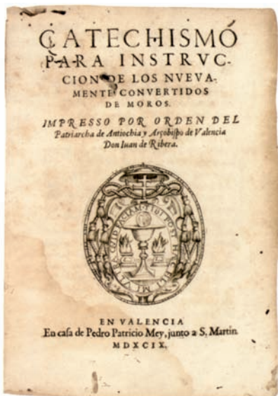
Manual per a capellans i predicadors encarregats de la conversió, editat a València el 1599.

litat van ser algunes de les disposicions (bona part de les quals, val a dir-ho, es podien saltar amb el pagament de multes). També es va intentar bastir una xarxa evangelitzadora per reconvertir els musulmans que ho continuaven essent malgrat bateigs i disposicions. I es van obrir processos inquisitorials als qui, d'amagat, mantenien la religió original.