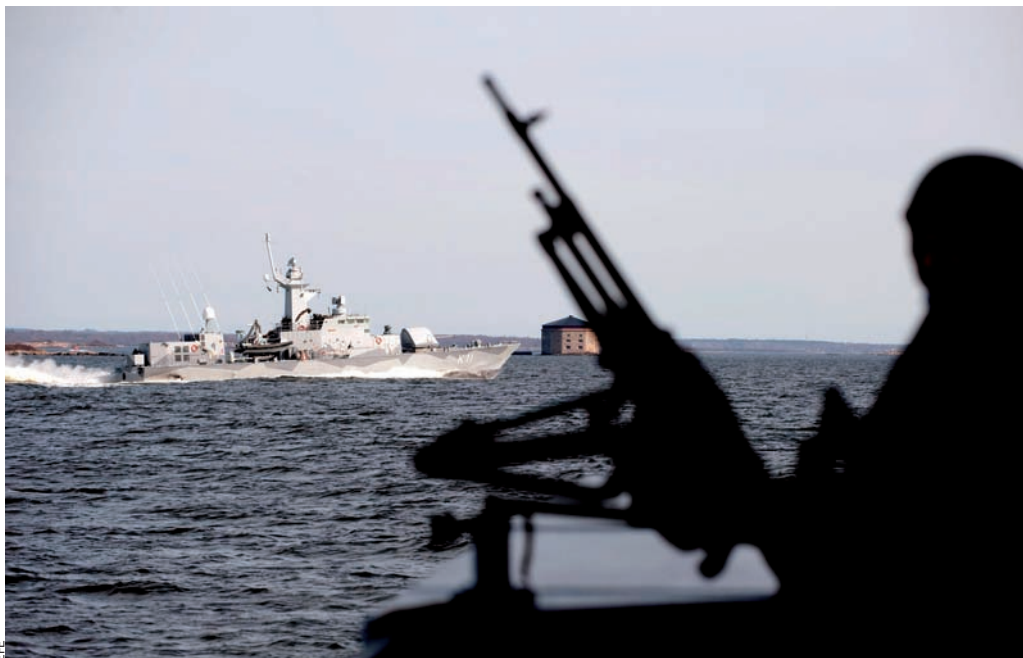
Els pirates deixen en evidència les grans potències mundials. Amb bots atrotinats de motor forabord i kalàixnikov, desafien fins i tot els vaixells de guerra dels països rics.

“Això realment és una societat anònima de pirateria”, diu Cloonan, “crim organitzat marítim.” Al principi les pretensions de les companyies marítimes i dels pirates són molt diferents. Els criminals demanen 15 milions, la companyia n’ofereix un. I aquí és on comença la guerra psicològica.