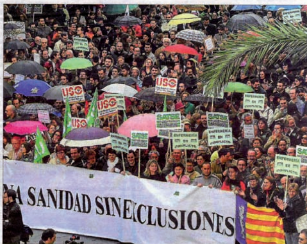
Los asistentes aguantaron una lluvia intermitente durante más de una hora.