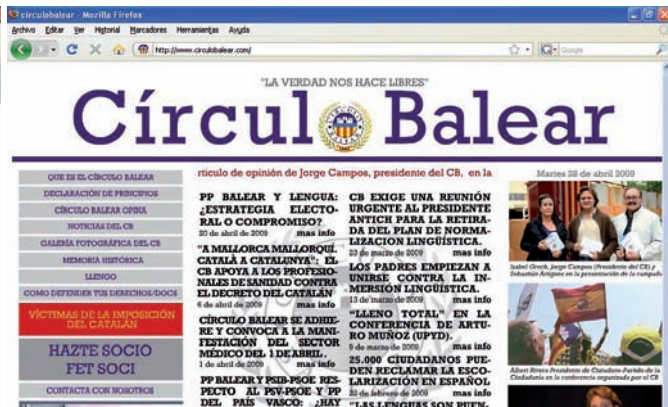
El diari digital Libertadbalear i l'entitat Círculo Balear , dos exemples del nou anticatalanisme a les illes Balears.